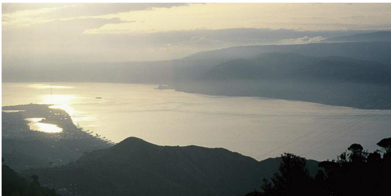
Fig. 6 - Veduta dello Stretto di Messina, ripreso dalla sponda siciliana. Attraverso lo stretto si stima che ogni anno transitino alcune decine di migliaia di uccelli da preda.

Un altro esempio di prelievo illegale che affonda le radici nel passato riguarda l'uccisione dei rapaci in migrazione. La realtà più conosciuta è quella relativa alla cosiddetta "caccia all'adorno", praticata in corrispondenza delle due sponde dello Stretto di Messina (Fig. 6). I rapaci vengono abbattuti con armi da fuoco quando transitano sullo stretto nel corso delle migrazioni. Un tempo il maggior numero di individui veniva ucciso in primavera, per via delle diverse modalità con cui avviene la migrazione di ritorno; attualmente il prelievo illegale è più intenso in autunno a seguito dell'attività di repressione condotta dal Corpo Forestale dello Stato, ora CUTFAAC, nei mesi primaverili. La specie più colpita è il falco pecchiaiolo (localmente chiamato "adorno"), tuttavia vengono abbattuti tutti gli uccelli veleggiatori in transito (come aquile e cicogne), anche appartenenti a specie rare o molto rare. L'uccisione dell'adorno pare sia legata a una credenza locale secondo la quale l'uomo che abbatte almeno un falco pecchiaiolo si assicura la fedeltà della propria sposa per l'anno successivo.