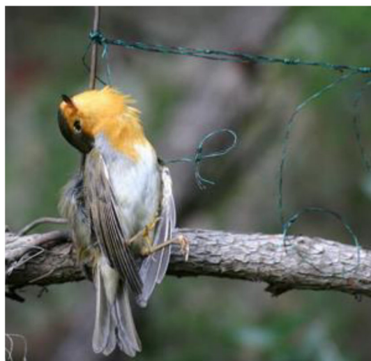
Fig. 3 - Lacci utilizzati in Sardegna per la cattura illecita dei tordi (dal sito http://www.komitee.de ).