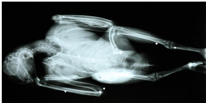
Fig. 4 - Radiografia di una femmina adulta di Lanario rinvenuta il 22 gennaio 2009 nel comune di Castenaso (BO). Nell'immagine sono riconoscibili nove pallini di diverso diametro.

L'incidenza del fenomeno è sottostimata, in quanto non tutti gli uccelli colpiti vengono recuperati; inoltre una parte dei rapaci feriti in modo non grave mantiene la possibilità di volo e non viene quindi rinvenuta e recuperata. Un ulteriore fattore che concorre a sottostimare la frequenza di questi atti illeciti risiede nel fatto che l'accertamento del ferimento con armi da fuoco spesso può avvenire solo tramite radiografia (Fig. 4); sfortunatamente molti centri di recupero non dispongono dei mezzi per poter effettuare questo test diagnostico su tutti i soggetti ricoverati.