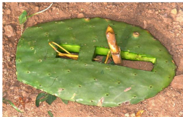
Fig. 2 - Tradizionale metodo di cattura nell'Arcipelago Pontino realizzato con una pala di fico d'india.

In Sardegna è diffusa una forma di cattura illecita ai tordi praticata principalmente tra novembre e febbraio nel Sulcis meridionale e nel Sarrabus. Qui i mezzi di cattura tradizionali sono rappresentati da crini di cavallo disposti sopra un rametto tra la vegetazione in modo da formare un cappio per gli uccelli che si posano (fig. 3). Oggi molto spesso al posto dei crini vengono impiegati fili di nylon e sono inoltre utilizzate reti e trappole. Altra tecnica impiegata è rappresentata da un laccetto ancorato a terra per mezzo di filo di ferro, su cui viene infissa una bacca come esca. I tordi vengono uccisi per finalità commerciali: vengono venduti a privati e ristoratori locali per la preparazione di un piatto tipico, le "grive" (i tordi in sardo) al mirto. Anche in questo caso, dal momento che i mezzi di cattura non sono selettivi, oltre ai tordi vengono uccisi uccelli appartenenti a molte altre specie: tra le vittime più frequenti, pettirossi, occhiocotti, pernici sarde, fringuelli e frosoni.