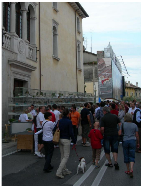
Fig. 5 - La Sagra Dei Osei di Sacile. A destra: tordo sassello durante la gara del canto. A sinistra: la fiera mercato degli uccelli.

Partecipando a manifestazioni come la Sagra di Sacile ci si rende conto di come ancora oggi in alcune realtà locali sia forte il legame con le attività di aucupio un tempo praticate diffusamente in molte regioni del centro-nord. Alla cattura di piccoli uccelli migratori sono collegate tradizioni culturali e gastronomiche che ancora ai nostri giorni alimentano forme di prelievo e di commercio illegali di uccelli selvatici destinati alla detenzione in cattività o alla preparazione di piatti della tradizione locale, come la cosiddetta “polenta e osei” 11 .