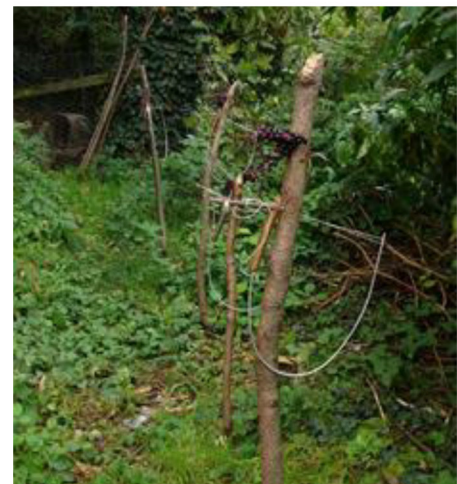
Fig. 1 - Catture illegali nelle Prealpi lombarde. A sinistra, Pettirosso ucciso da una trappola "sep". A destra, fila di archetti posizionati per la cattura.