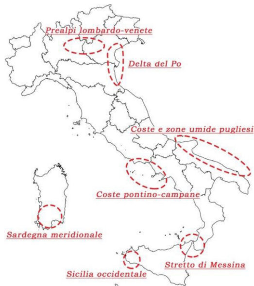
Fig. 7 - I black-spot dove le attività illecite nei confronti degli uccelli sono più intense.

I risultati delle indagini effettuate nel corso degli anni hanno permesso di mettere in luce come i reati contro gli uccelli selvatici non avvengano con la stessa frequenza sull'intero territorio nazionale. In alcune aree il fenomeno risulta particolarmente intenso; queste aree vengono definite black-spot secondo una terminologia riconosciuta a livello internazionale. In Italia è possibile individuare almeno sette black-spot : le Prealpi lombardo-venete, il Delta del Po, le coste pontino-campane, le coste e zone umide pugliesi, la Sardegna meridionale, la Sicilia occidentale e lo Stretto di Messina (Fig. 7). A queste zone “calde” se ne aggiungono altre dove il prelievo illegale di uccelli selvatici, pur non essendo intenso come nei black-spot , appare comunque più frequente che nelle restanti parti del territorio. Tra queste ne compaiono alcune contraddistinte da elevate densità di cacciatori (come la Liguria, la fascia costiera della Toscana, la Romagna, le Marche) o caratterizzate dalla presenza di pratiche venatorie tradizionali oggi non più consentite dalla normativa vigente (come il Friuli-Venezia Giulia e parte del Veneto, dove un tempo era diffusa l'uccellazione).